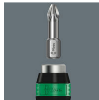
Polyvalence grâce au remplacement éclair des embouts ou des douilles possible grâce à la technologie Rapidaptor.