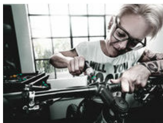
Tournevis dynamométriques pré-réglés ajustables