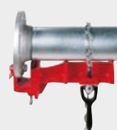
Étau pour soudage de brides