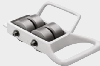
Rouleau de tube pour chanfreinage (Modèle 258 seulement)