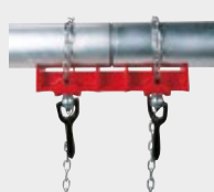
Étau pour soudage de tubes en ligne