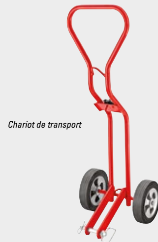
Chariot de transport

(TOOLTIP) Lorsque vous utilisez les coupe-tubes 258 et 258XL avec des longs tubes, vous devez impérativement soutenir correctement le tube pour éviter d'endommager la molette. Des servantes de tube supplémentaires peuvent s'avérer nécessaires et la zone de travail doit être de niveau.