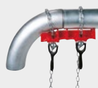
Étau pour soudage de coudes