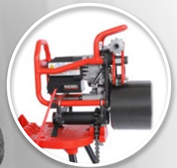
Support de montage TBM-36