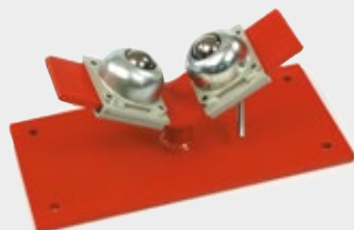
Servante de tubes à bille