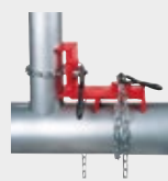
Étau pour soudage de tubes en angle